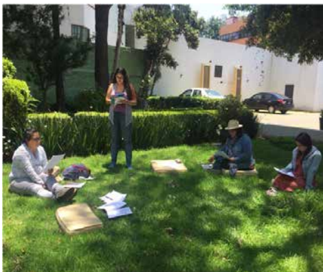
En los jardines de la CANIEM se realizó la certificación de Promoción de la Lectura.

Finalmente, en la tercera reunión se verificó para el estándar EC0538 Venta de libros para librería con el objetivo de determinar la procedencia o no de las evaluaciones realizadas a 11 Vendedores de libros de las Librerías Politécnicas a cargo de