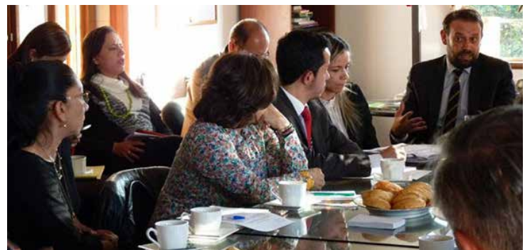
El Cerlalc asesorará a la Biblioteca Nacional de Colombia en la implementación del estatuto.

* El Centro Regional para el Fomento del Libro en América Latina y el Caribe, Cerlalc, es un organismo intergubernamental, bajo los auspicios de la UNESCO, con oficina sede en Colombia.