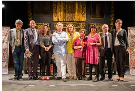
DiVerso 2018 retoma el lema “Desbordando fronteras” para hacer hincapié en la fuerza de la poesía desdoblándose en otras formas culturales.

La tercera edición de Di/Verso, continuó Vázquez Martín, también concentra las dos experiencias previas. “El primer festival tuvo como propósito