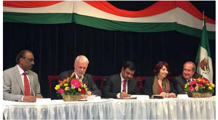
La agencia encargada de coordinar la presencia de India en la FIL será el National Book Trust of India (NBT).

distintas ferias internacionales del libro en todo el mundo y ha participado como Invitado de Honor en Frankfurt (2006), Moscú (2009), Beijing (2010) y Seúl (2013). El NBT organiza la Feria Mundial del Libro de Nueva Delhi en enero de cada año, que es el mayor evento del libro en la región afroasiática. Expresando su felicidad por la invitación especial a la India, el embajador Muktesh Pardeshi dijo que “la participación de la India en la FIL Guadalajara 2019 como país Invitado de Honor mejorará aún más los vínculos culturales, literarios y sociales entre dos culturas antiguas”.