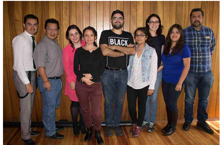
Participantes del curso.

Ha implementado sistemas de desarrollo infográfico y arquitectura de la información para diversas casas editoriales, así como proyectos de análisis y conceptualización de la información para diversas empresas. Se especializa en el manejo de gráficos de información, ilustración, modelado 3d, programación, diseño gráfico y multimedia. Cuenta con varias distinciones a nivel nacional e internacional en reconocimiento a sus proyectos.