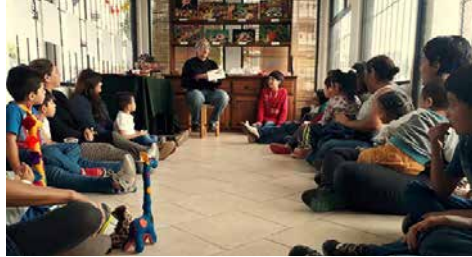
Un evento de colaboración entre librerías y editoriales que dio frutos.

Una de las grandes oportunidades como librería independiente, es que tenemos plena libertad de acercarnos o no a los fondos de cada editorial, por supuesto de la misma manera que las editoriales pueden aceptar o no que nosotros seamos un punto de venta para sus materiales. En este sentido, en cuanto recibimos la lista de las editoriales que decidieron aventurarse a participar en este