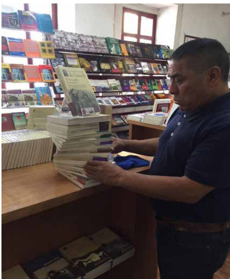
Han suscitado gran interés las certificaciones del CONOCER que ofrece la CANIEM.

medio de evidencias, que cuentan, sin importar como los hayan adquirido, con los conocimientos, habilidades y destrezas necesarias para cumplir una función a un alto nivel de desempeño de acuerdo con lo definido en un Estándar de Competencias.