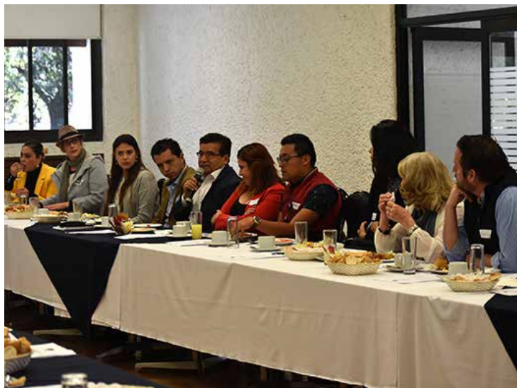
Los asistentes se mostraron interesados y muy participativos.