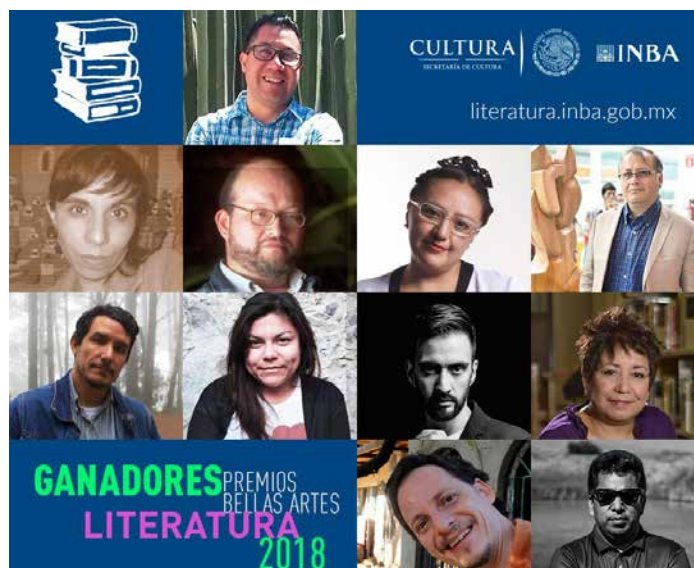
Ellos fueron los ganadores del Premio Bellas Artes de Literatura 2018.