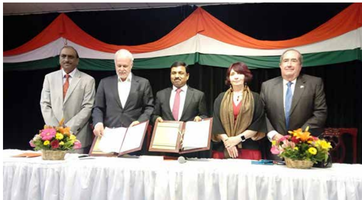
El embajador de India en México, Muktesh Pardeshi, comentó que para su país es un honor ser el invitado en la FIL de Guadalajara.

El National Book Trust of India (NBT) será la agencia que coordinará la presencia de este país en la FIL Guadalajara. El NBT participa regularmente en