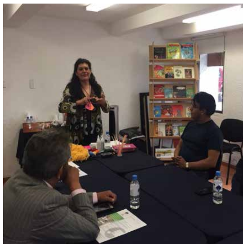
Con gran entusiasmo participaron los asistentes.

Aprovechamos esta oportunidad para reiterar que la certificación de competencias es el proceso a través del cual las personas demuestran por