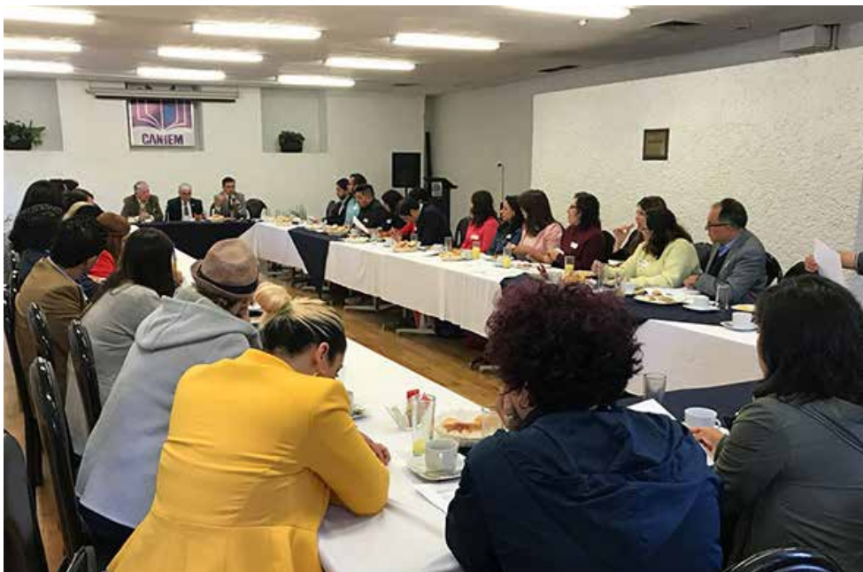
Una buena respuesta obtuvo esta primera convocatoria al Encuentro de Áreas de Comunicación de la Industria Editorial.

Esta iniciativa surge desde la Coordinación de Comunicación de la Cámara teniendo como premisa que las áreas de comunicación, prensa y marketing, son áreas estratégicas de las empresas a las que pertenecen, y si se unen esfuerzos junto con la CANIEM como un socio estratégico, puede redundar en algo benéfico para nuestra industria, de ahí que se haya convocado a través del Boletín Editores a las áreas de comunicación de las empresas editoriales afiliadas a la CANIEM, organizando un Encuentro de sus titulares, con el objetivo de tener un primer acercamiento con ellas y ellos, para conformar un directorio e iniciar una serie de acciones en pro del gremio editorial mexicano.